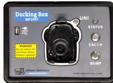
UNI Docking Box