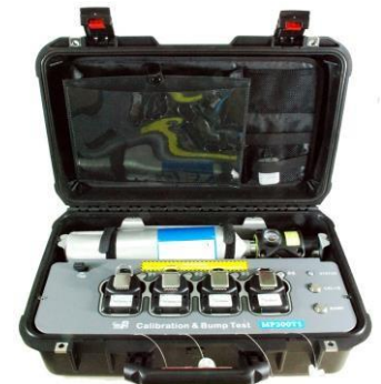
CaliCase Docking Station